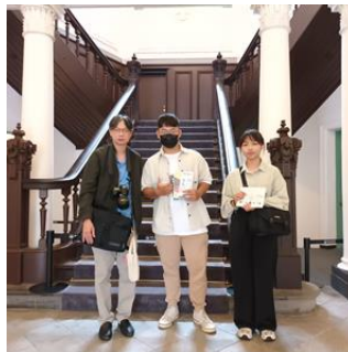
師生於鐵道博物園區合影

從上述案例中，可得知學生藉由導師帶領參加珍珠學生計畫後，他們自認已蛻變了不少，並成功提升自信心，並激發出其解決問題之能力。而這些皆是推動培育珍珠學生計畫之成效，亦為本處將會持續推動該計畫之原因。