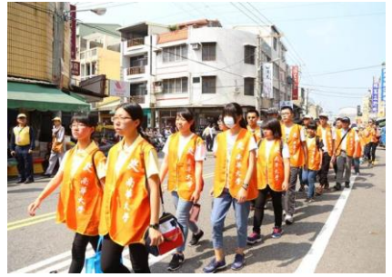
百萬人興學行腳托鉢募款