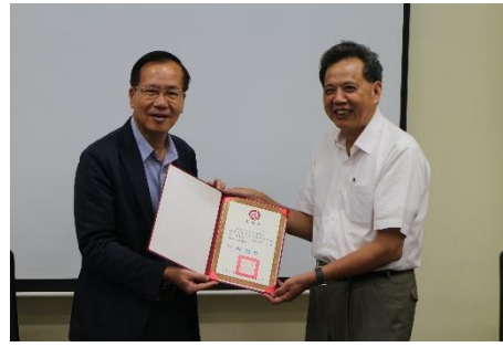
外部募款資源開發

透過與企業之合作，提供經濟不利學生參訪、見習、實習，強化學生專業能力，並積極與企業、民間非營利組織等，簽署產學合作資助培育特定專業人才策略聯盟同意書，透過企業或組織資助認養經濟不利學生，讓學生安心學習，並增加弱勢學生就業率。策略聯盟企業單位依人力需求優先挑選經濟不利學生作為認養對象，經雙方同意後，與企業簽署學生認養合約書，企業將安排經濟不利學生的實習課程，並由認養企業提供學生實習津貼。