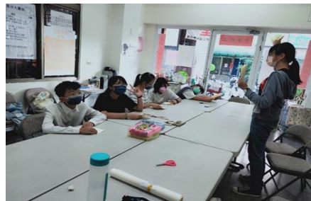
珍珠學生帶領活動