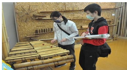
學生體驗竹樂器樂趣