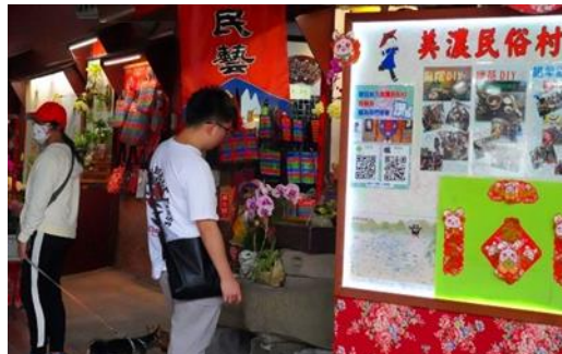
師生至美濃民俗村進行文化踏查