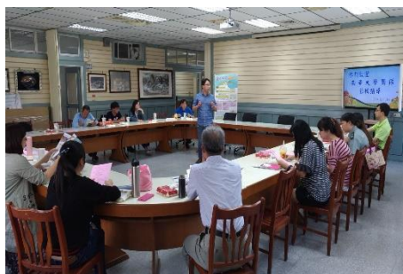
招收弱勢學生情形

進行弱勢助學宣導活動，辦理各地區（基隆區、新北區、苗栗區、台中區、南投區、嘉義區、雲林區、台南區、高雄區、屏東區、台東區）校長座談會，參加的人員有高中職端校長、秘書、行政主管、高三導師及高三同學，活動總共辦理了 242 場次，參加的同學超過 9,000 人次。