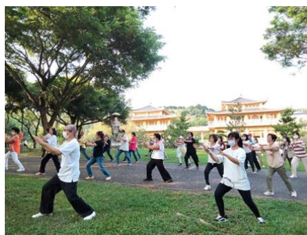
在佛陀紀念館植物園進行青銀共學