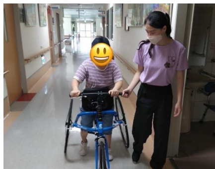
珍珠學生協助服務對象騎競速車