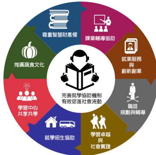
經濟不利學生輔導措施

本校以落實「獎優扶弱」扶助理念，協助經濟不利學生安心就學，結合各行政單位推動業務，規劃八大面向 20 項輔導措施，提供經濟不利學生從課業補救、自覺學習、職場體驗、創新創業、職涯輔導、學習表現、社團領導、志願服務、校外競賽、蔬食推廣、學習中心等多元輔導環境，可自行依照課程進度規劃，利用課餘時間選擇喜好參與項目，減少需要外出打工的時間及擔憂讀書時間不足，能快樂學習又能同時獲得獎助金，安心完成大學學業，讓自己具備足夠知識、涵養及感恩態度，進而畢業即就業，希未來假以時日有機會亦能回饋社會。